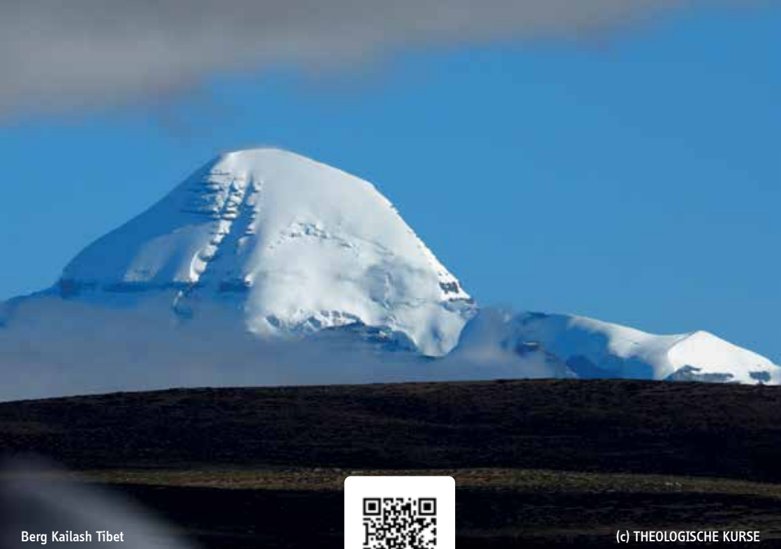
Berg Kailash Tibet