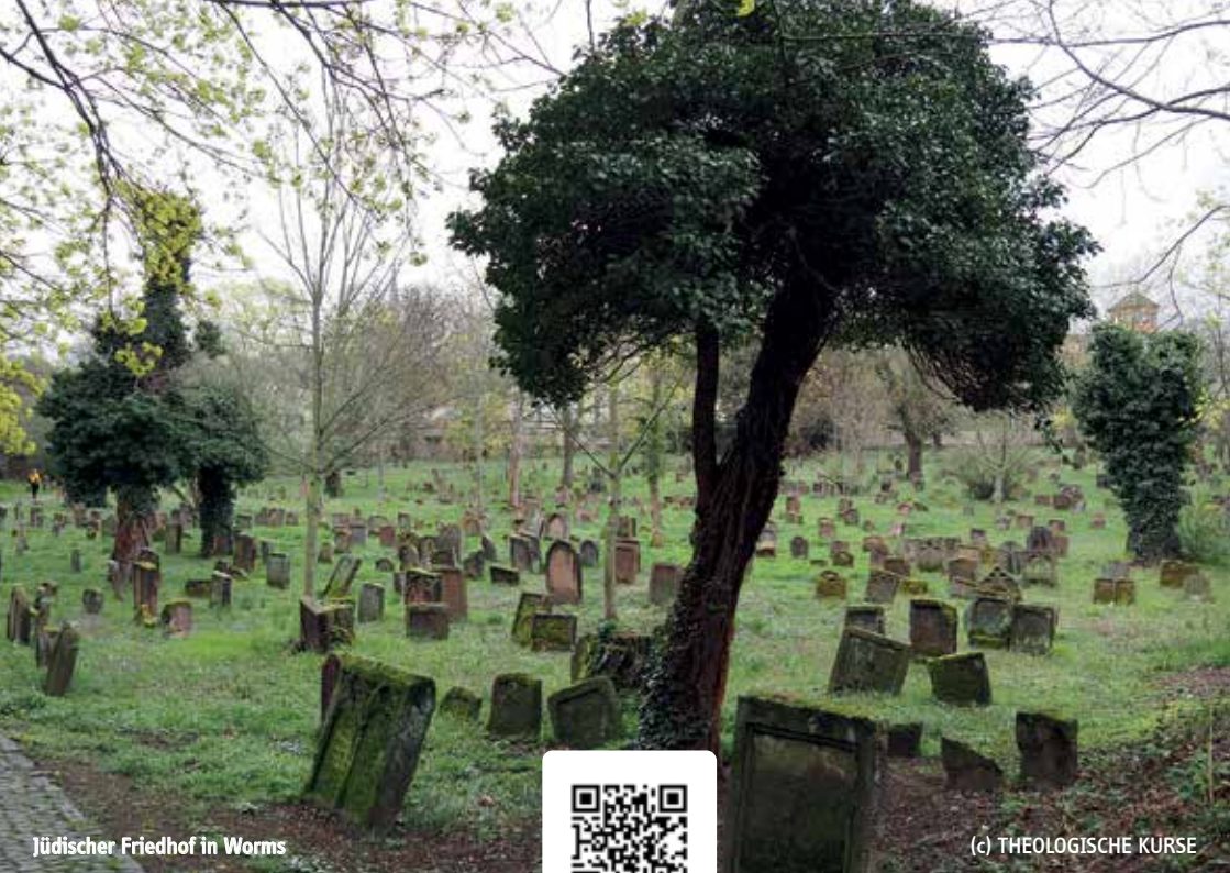
Jüdischer Friedhof in Worms