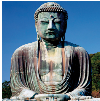
Der große Buddha, Kamakura, Japan