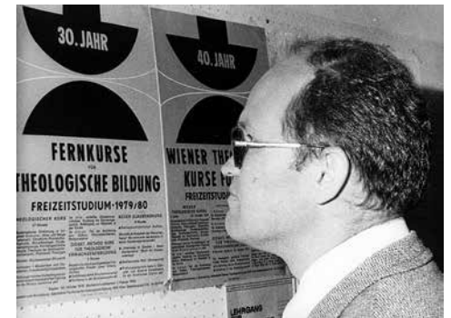
Vor dem Plakat

In den Sozialphasen war es bedeutend leichter, das gewandelte Selbstverständnis von Kirche und Theologie zu vermitteln: Die Dozenten waren ja schließlich mit der Literatur und der theologischen Diskussion vertraut, die dann – für viele Konzilsväter und gewiss auch für viele Theologen doch unerwartet – im Konzil zum Durchbruch gekommen war. Um die Mit-