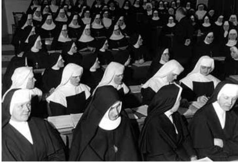
Kurs für Ordensfrauen

flektiert-religiöses Wissen erwerben, desto besser ist das nicht nur für den Stand der Laien und die Erfüllung ihrer Missionsaufgabe, sondern auch für Priester und Seelsorger, ja, für das gesamte religiös-kirchliche Leben. Es wäre sehr kurzfristig, darin eine Kon-